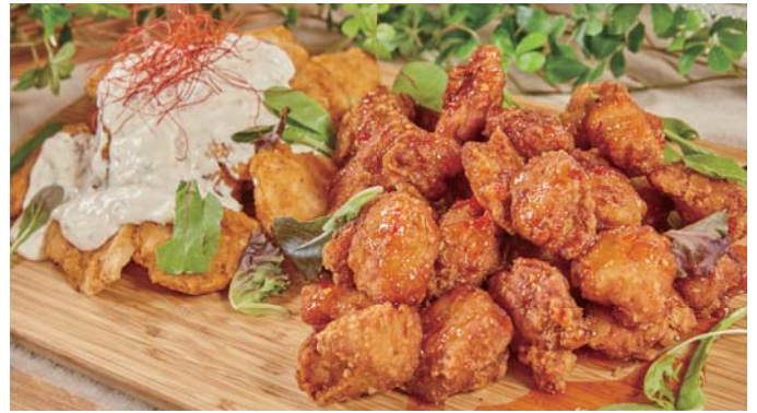
フィッシュ & ミートフリット