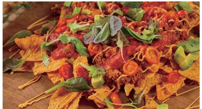
アボカドとタコスミートのディップ