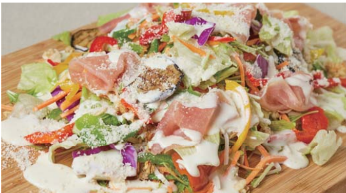
生ハムと有機野菜のシーザーサラダ